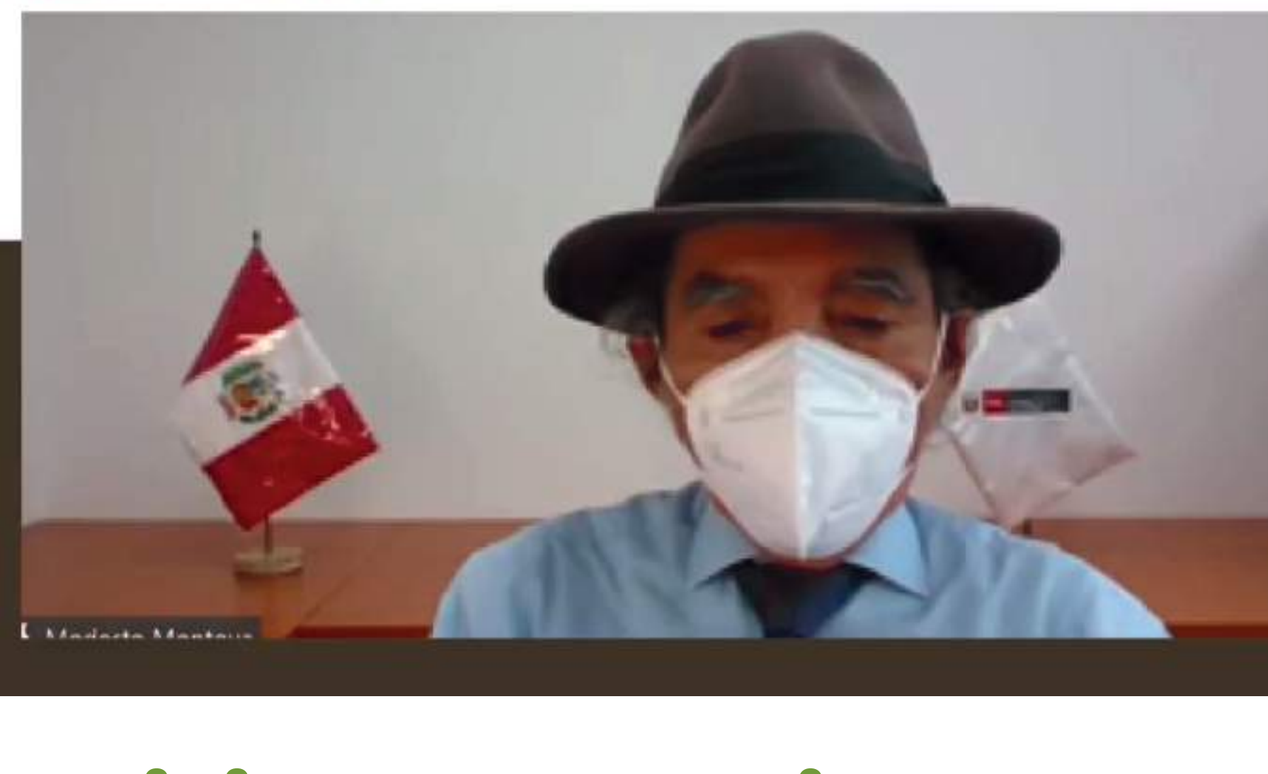
Modesto Montoya Zavaleta Ministro del Ambiente MINAM