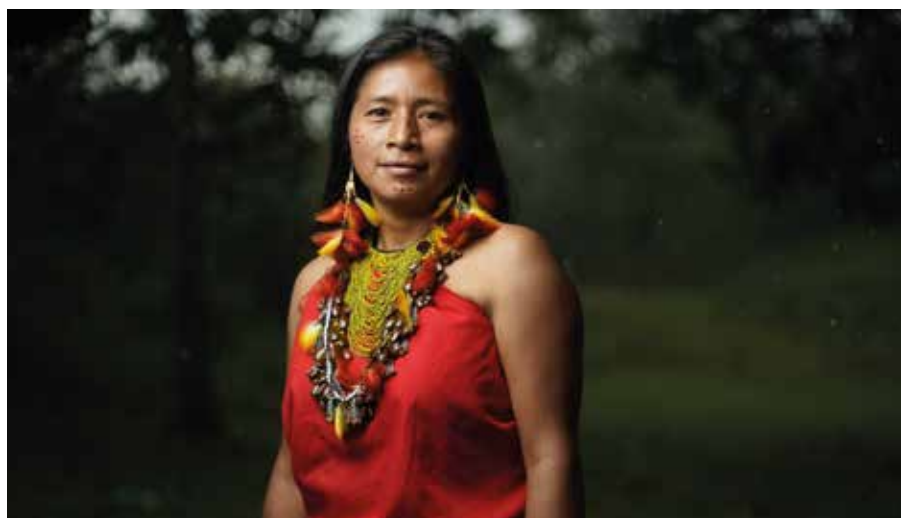
Destacan en artesanía, alimentos, cultivo y promoción del turismo