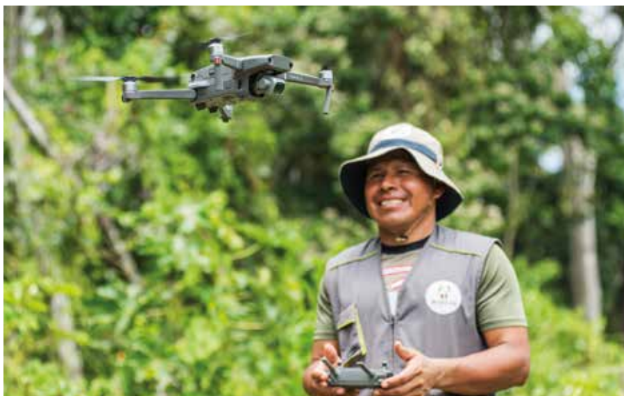
Programa Bosques fortalece su labor por la conservación al 2030

Programa Bosques del Minam emprende nueva etapa a favor de la conservación, junto a comunidades nativas y campesinas, organizaciones indígenas, gobiernos regionales y locales, entre otros actores clave.