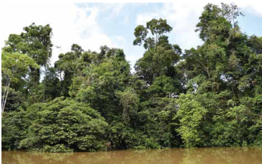
Día Internacional de los bosques - 21 de marzo